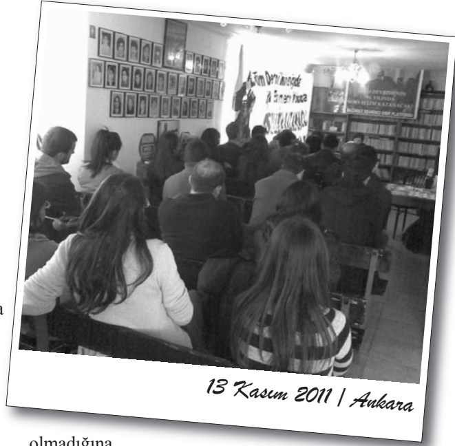
13 Kasım 2011 | Ankara

Şiir dinletisinden sonra BDSP temsilcisi bir sunum gerçekleştirdi. Öncelikle Ekim Devrimi'nin tarihsel önemine değinilen sunumda; Tunus-Mısır dersleri ışığında o bölgede işçi sınıfı ve emekçilerin hareketlenmelerine öncülük edecek bir sınıf partisi