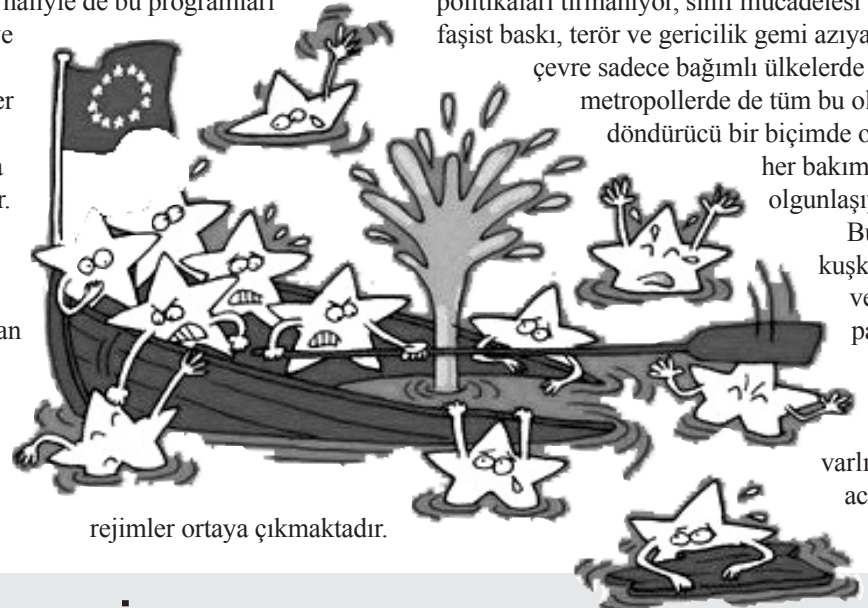
rejimler ortaya çıkmaktadır.

Kuşkusuz ki emperyalistlerin bu olağanüstü yönetim biçimlerine başvurmalarının en önemli nedeni büyüyen sınıf mücadelesidir. Mevcut hükümetler, emekçilere yönelik saldırı planlarını uygulayarak büyük bir yıpranmışlık içerisindeydiler ve düzen partileri içerisinde onların yerini dolduracak işlevsel bir alternatifleri de yoktu. Zaten hangi burjuva hükümeti olursa olsun şu durumda uygulayacakları programları da tektir. Bu programlar emperyalist şefler ve mali tekellerin yöneticilerince hazırlanmış ağır yıkım programlarıdır. Bu haliyle de bu programları uygulama iradesi ve gücü bugünkü burjuva parlamenter sisteminin koşullarında ortaya çıkarılamamaktadır. Bu durumda da emekçi düşmanı acımasız yıkım programlarını zaman kaybetmeden sakınmasız bir biçimde uygulamak üzere olağanüstü